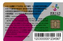
晶片悠遊卡卡號共 16 碼