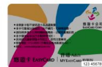
特製版悠遊卡卡號共 10 碼