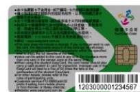
新一代學生悠遊卡卡號共 16 碼