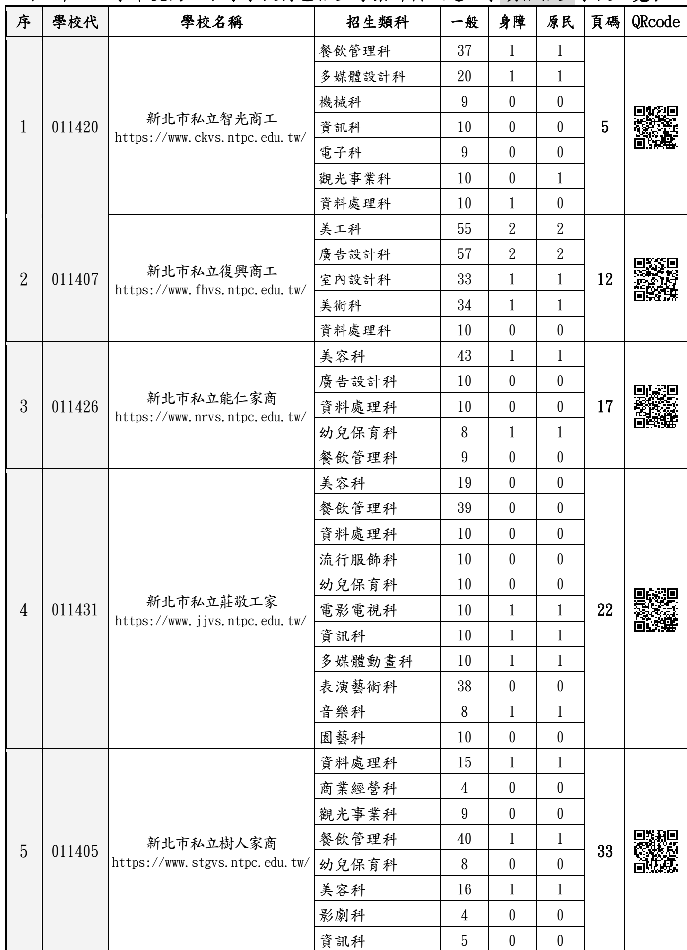
新北市 114 學年度高級中等學校特色招生專業群科甄選入學續招招生學校一覽表